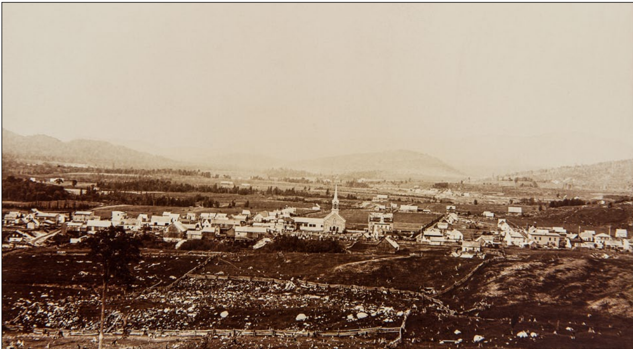
Le village de Saint-Jovite, photographié en 1894, une vingtaine d'années après le début des défrichements. On remarque les clôtures, les roches qui parsèment les champs et, en face de l'église, les pierres tombales du premier cimetière.

s'estompent avec l'arrivée de voisins, le développement du noyau villageois, l'aménagement de chemins. Un jour, le colon convie ses voisins à une corvée : avec des troncs qu'il a fait équarrir dans une scierie du village ou qu'il a lui-même taillés, il monte le carré d'une vraie maison, pourvue de planchers, de fenêtres, d'un poêle à bois, une maison dite « en pièce sur pièce ». Peu à peu, le colon devient un habitant .