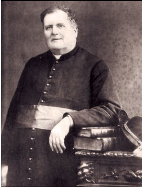
Antoine Labelle, le « roi du Nord ».

Aucun personnage historique des Laurentides n'est plus connu que le curé Labelle. La mémoire de celui qu'on surnommait « le roi du Nord » est honorée dans de nombreux toponymes, monuments et fresques murales (voir la section Repères), de même que dans l'œuvre télévisuelle de Claude-Henri Grignon, Les Belles Histoires des Pays d'en haut . Obsédé par son œuvre de colonisation et par son projet de chemin de fer, ce colosse de 136 kg (300 lb) déploie pendant un peu plus de 21 ans une énergie hors du commun pour arriver à ses fins. À pied, en canot, en voiture à cheval, il parcourt lui-même les forêts inhospitalières du Nord. En route, il plante une croix pour déterminer l'emplacement des futures églises, noyau des villages à venir; il observe la topographie, la qualité du sol, les cours d'eau 4 ; il encourage les nouveaux colons. De retour à Saint-Jérôme, il harcèle littéralement les hommes politiques pour obtenir la construction des chemins de colonisation, l'arpentage de nouveaux cantons, des subsides pour ses colons, et surtout pour faire construire un chemin de fer entre Montréal et les cantons du Nord. On estime que l'action du curé Labelle a mené à la création d'une vingtaine de nouvelles paroisses entre Sainte-Agathe-des-Monts et Mont-Laurier. On lui doit aussi l'implantation du chemin de fer entre Montréal et Mont-Laurier, devenu en 1996 le parc linéaire du P'tit Train du Nord.