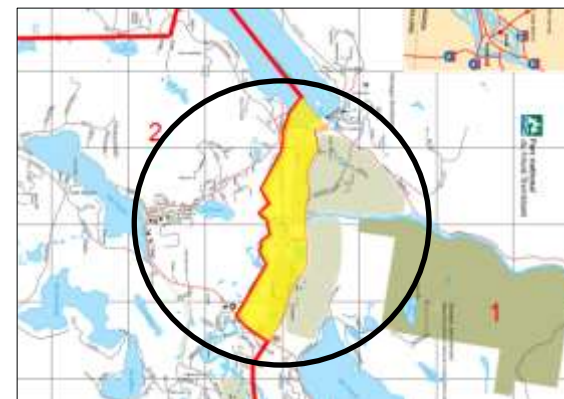
En jaune, changement suite à la nouvelle délimitation.

Donné à Mont-Tremblant, ce 18 mars 2020.